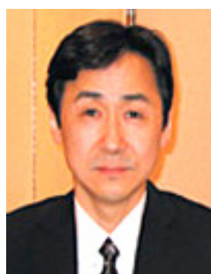
プログラムリーダー

このプログラムは、研修環境が充実した静岡県内の研修病院のネットワークにより、胸部外科領域の専門医(心臓血管外科専門医、呼吸器外科専門医)を養成するために作成しました。静岡県は全国で10番目に多い人口370万人を抱え、さまざまな経済および産業関連指標も全国10位前後となっています。しかし医師数は全国41位であり、もともと志望者が少ない胸部外科領域の専門医不足は深刻な状況になっています。静岡県で胸部外科領域の専門医を志望する皆さんの積極的な応募を期待しています。