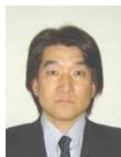
プログラムリーダー