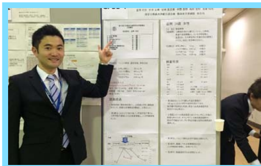
学会ポスター発表