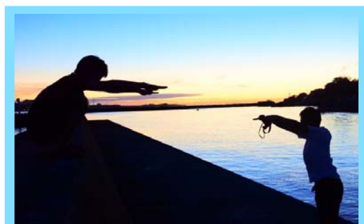
地域研修（もとぶ野毛病院）