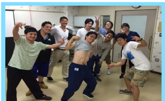
医局旅行 出し物練習