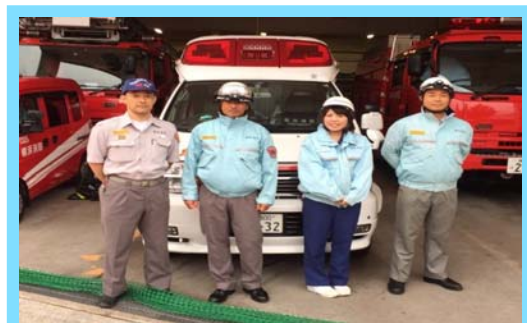
救急自動車同乗実習